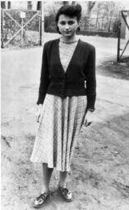
Kaufmännischer Lehrling der Ventilatorfabrik Schiele & Co. in Eschborn, 1951.

Nach dem Zweiten Weltkrieg konnte auf diesen Grundlagen aufgebaut werden. Zu der betrieblichen Ausbildung kam nun die Berufsschule, die für alle Lehrlinge und Anlernlinge Pflicht wurde. Die bei den Industrie- und Handelskammern bzw. bei den Handwerkskammern angesiedelten Prüfungsausschüsse wurden paritätisch mit Vertretern der Arbeitgeber, der Gewerkschaft und der Berufsschulen besetzt. Probleme, eine Lehrstelle zu finden, hatten die Schulabgänger in den ersten zwei Jahrzehnten der Bundesrepublik noch nicht, im Gegenteil: Die Unternehmen suchten händerin-