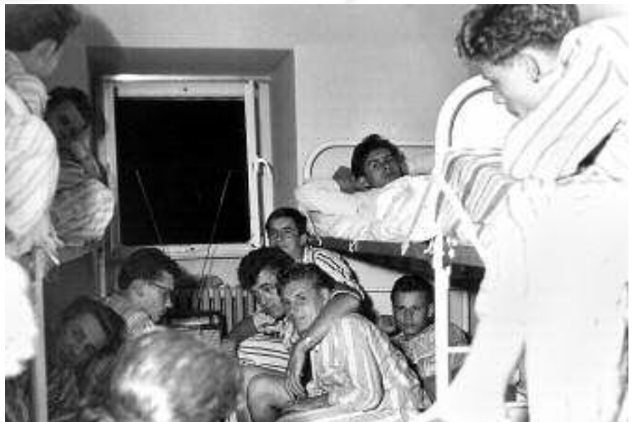
Lehrlinge der Glanzstoffwerke Kelsterbach auf einer gemeinsamen Freizeit im Schullandheim Freisheim, um 1960.

Die Aspekte, die eine Ausstellung zum Thema Berufsausbildung zu berücksichtigen hat, sind, wie man sieht, sehr vielfältig. Sie muss die historische Entwicklung berücksichtigen, aber auch die Frage nach dem gegenwärtigen Zustand und der Zukunftsfähigkeit stellen. Entscheidend für eine anschauliche Umsetzung des Konzepts wird wie bei den bisherigen Ausstellungen des Hessischen Wirtschaftsarchivs die Unterstützung aus den Unternehmen sein. Insbesondere die Fördermitglieder des Hessischen Wirtschaftsarchivs werden deshalb herzlich gebeten, mit Ideen, Vorschlägen und Dokumenten zum Gelingen der Ausstellung beizutragen.