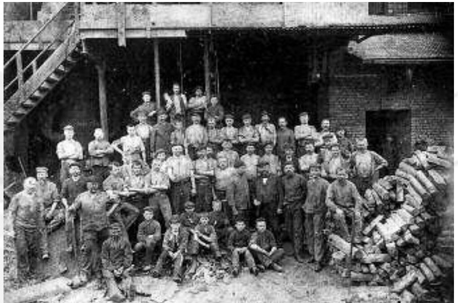
Arbeiter und Lehrlinge vor der Gießereihalle der Werkzeugmaschinenfabrik Heyligenstaedt & Comp. in Gießen, um 1910.

Die größeren Betriebe begannen deshalb seit etwa 1870 damit, eigene Lehrlingswerkstätten einzurichten. Gewerbe- und Handelsvereine und später auch die Handelskammern gründeten daneben Fortbildungsschulen, aus denen zu Beginn des 20. Jahrhunderts die ersten Berufsschulen hervorgingen. Die Jahre zwischen den beiden Weltkriegen waren geprägt von den Bemühungen der Industrie- und Handelskammern, die Ausbildungsinhalte für die einzelnen Lehrberufe zu vereinheitlichen und verbindliche Lehrprüfungen einzuführen. Prüfungen für Kaufmannsgehilfen und Industriefacharbeiter der verschiedenen Fachrichtungen gibt es in Hessen seit 1929.